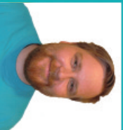
Christoffer Prosjektleder bad