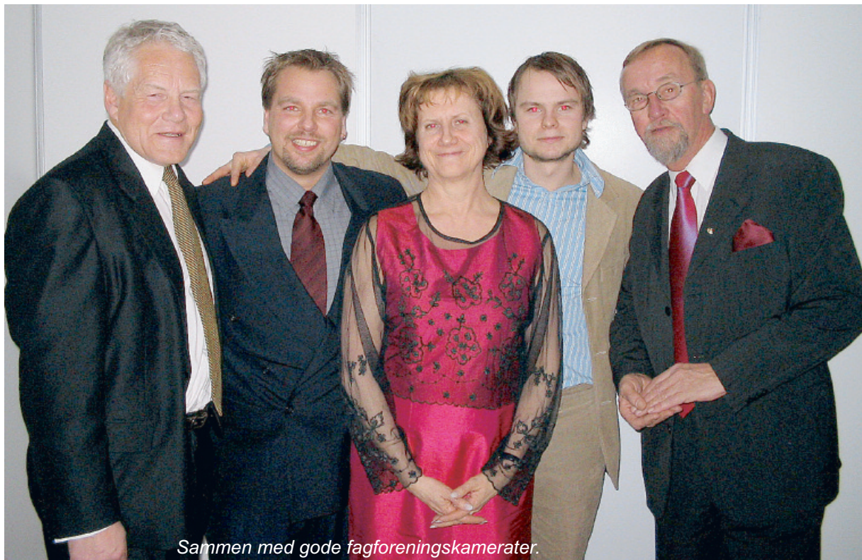
Sammen med gode fagforeningskamerater.

Det er mange skjebner som mister livsgrunlaget sitt, og som tillitsvalgt så deler man deres sorg og smerte, samtidig som man har sin egen smerte og usikkerhet å håndtere.