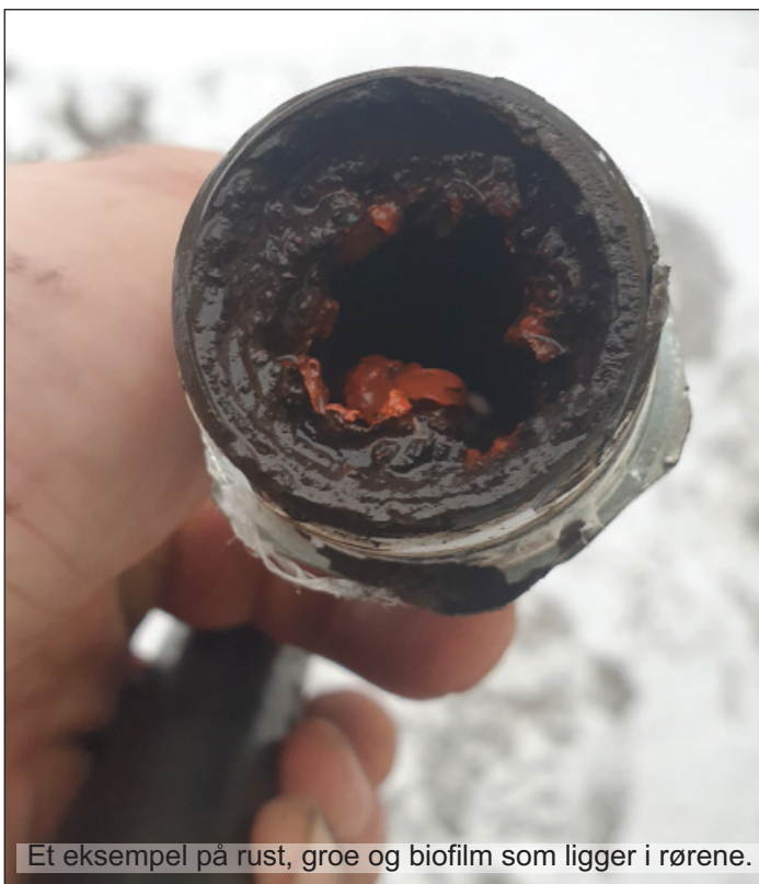
Et eksempel på rust, groe og biofilm som ligger i rørene.

- De nye varmepumpene er meget energieffektive med en virkningsgrad på opptil 4,5 for luft - vann og 5,5 for borehullspumper. Det vil si at for 1 kilowatt-time, får du en varmemengde som tilsvarer minst 4,5 kWh.