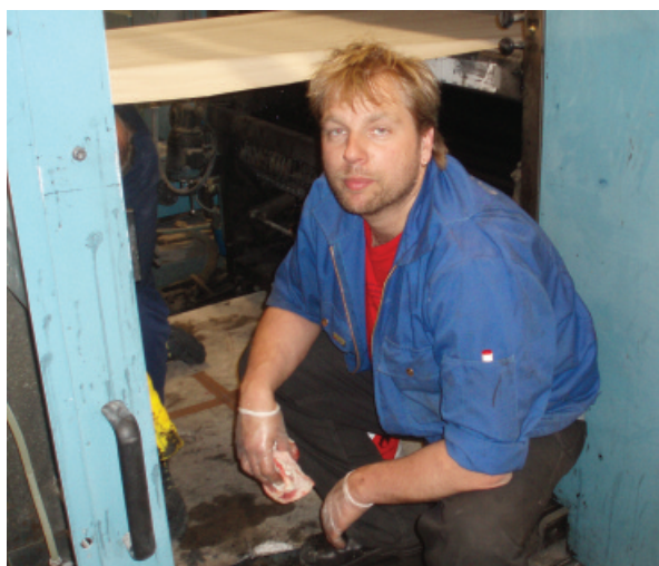
Sliten trykker etter et langt nattskift, for å rekke trykke Harry Potter til lanseringsdato.

- Vi jobbet hardt og målrettet med å få inn nye eiere, for å starte bedriften opp igjen. Noe vi dessverre ikke greide, da konkursen